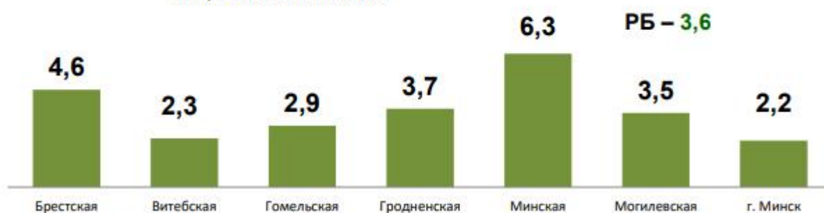
Рис.2 Коэффициенты частоты производственного травматизма в разрезе регионов за 2020 год, случаев на 100 тыс. застрахованных.

Наибольший удельный вес среди пострадавших в 2020 году в результате несчастных случаев на производстве составили работающие в возрастном диапазоне «51 – 60 лет (включительно)» (таблица 1).