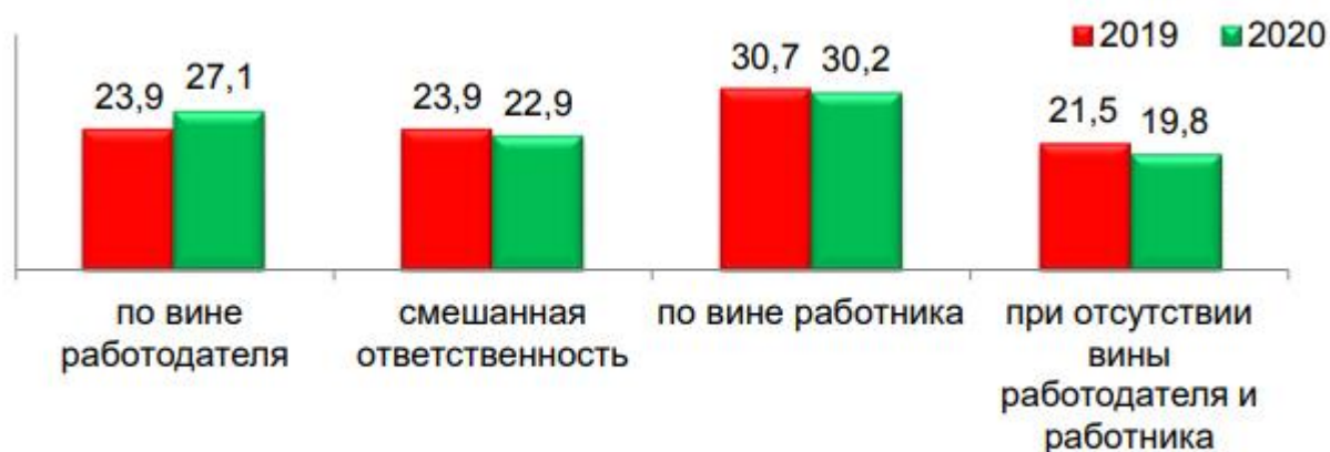
Рис. 4 Распределение ответственности по случаям со смертельным исходом, %

Анализ завершенных расследований несчастных случаев на производстве свидетельствует, что большинство подобных происшествий обусловлено неисполнением работодателями и (или) самими работающими требований охраны труда, причем это характерно для организаций всех форм собственности (рисунок 4).