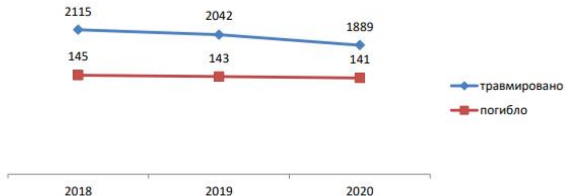
Рис.1 Динамика производственного травматизма, человек

Следует отметить, что удельный вес количества погибших в результате несчастных случаев на производстве в сравнении с общим количеством лиц, погибших от внешних причин, не превышает 3 процентов.